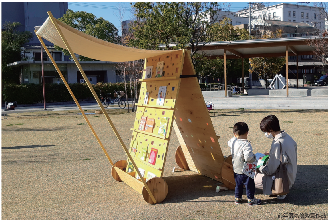
前年度最優秀賞作品

福山市中央図書館に付属する中央公園芝生広場にて定期的開催されるイベント「NIWASAKI」では、子どもからおとなまで青空の下で思い思いの時間を過ごしている。 中央図書館司書による青空図書コーナーや読み聞かせイベントでは、芝生広場の上に「本棚」が置かれる。開放的な空間に包まれながら本と触れ合う時間は子どものみならずおとな達もびのびと楽しい時間になっている。 公園という空間が人と人、人とまちをつないでいく場所となることで、日常生活を豊かにするきっかけとなるよう官民が連携し取り組む「NIWASAKI」。「読み聴かせる側」、「聴く側」、「青空」、「芝生広場」といった関係性のみならず、公園全体の中での「本棚」としてあるべき姿を問う。