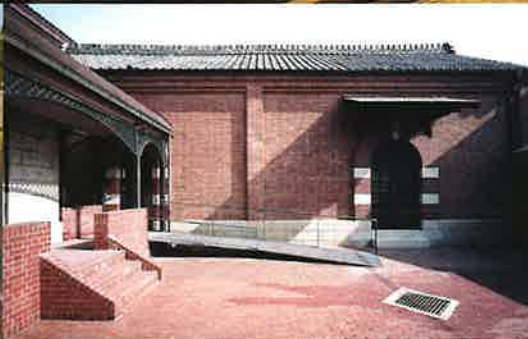
PORT ART & DESIGN TSUYAMA (旧妹尾銀行 林田支店 1920)