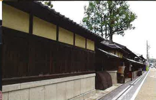
城東伝統的建造物群保存地区